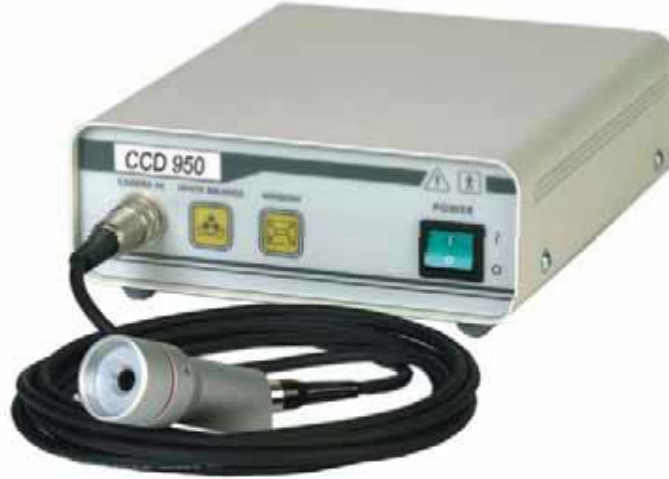
Video Kamera CCD-950 Video-Camera CCD-950

95-00503 Video-Kamera CCD-950 C-Mount Objektif Dahil 28mm 95-00512